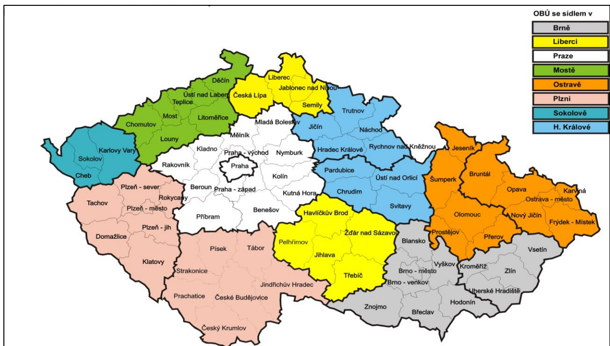
Obrázek 1 Hranice působnosti jednotlivých Obvodní báňský úřad pro území krajů Moravskoslezského a Olomouckého .

Místní působnost OBÚ stanoví zákon č. 61/1988 Sb. Sídla těchto úřadů jsou stanovena vyhláškou č. 394/2011 Sb., o sídlech obvodních báňských úřadů. Hranice působnosti jednotlivých OBÚ znázorňuje obrázek č. 1.